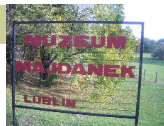
Στρατόπεδο συγκέντρωσης MAJDANEK