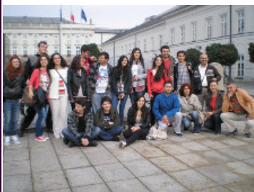
Βαρσοβία με την Τούρκικη αντιπροσωπεία