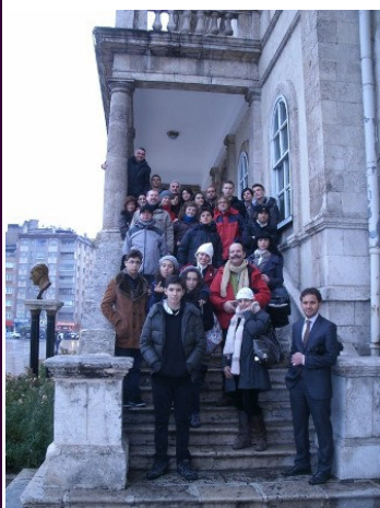
Φωτογραφία στο κογκρέσο