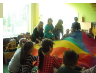
Συμμετοχή σε δραστηριότητες