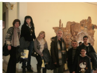
Στο δημαρχείο της πόλης Σεβάστειας